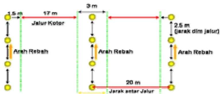
Gambar. 2. Skema Pembuatan Tanaman Shorea smithiana

Kegiatan penyiapan lapangan : Pembuatan Jalur Tanaman, Pembuatan dan Pemasangan Ajir dan Pembuatan Lubang Tanaman.